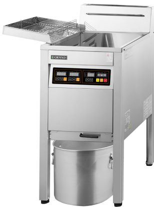
상업용 가스 튀김기 (22리터)