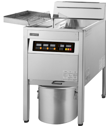
상업용 가스 튀김기 (29리터)