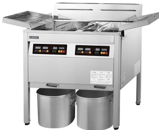
상업용 가스 튀김기 (22리터 × 2개)